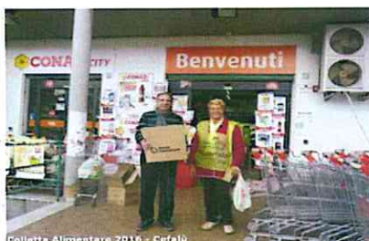
Colletta Alimentare 2016 - Cefalù