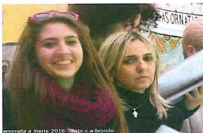
SerenataMaria2016 - prima