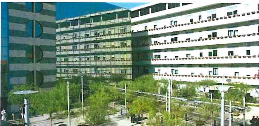
L'ospedale Giglio di Cefalù

Il nuovo servizio è stato illustrato ai medici di medicina generale.