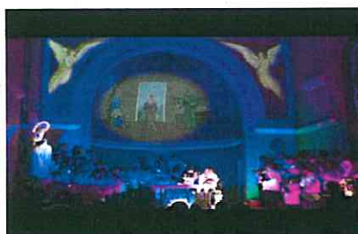
Serenata a Maria 2016 Parrocch...